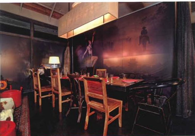
图5 室内装饰全部由设计师本人在多年的旅途中收藏的物品，这些物品是原汁原味的古物和体现民族特色的文化工艺品

图4 吧台处看到数个大型的彩色龙头，悬挂于吧台的上方。这样的装饰物来源于中国常见庆祝新年时所用的装饰